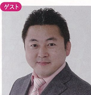
ゲスト 舞の海 秀平さん 大相撲解説者