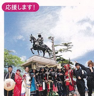
応援します! 伊達武将隊 奥州・仙台おもてなし集団