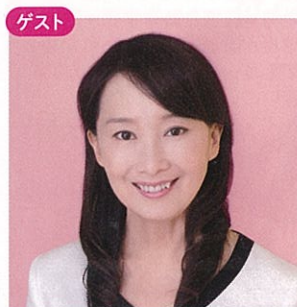
ゲスト アグネス・チャンさん 歌手・エッセイスト・ 教育学博士[Ph.D.]・ 日本対がん協会「ほほえみ大使」