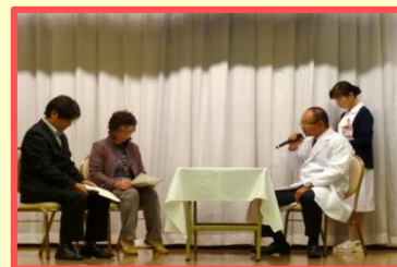
写真は寸劇のイメージです