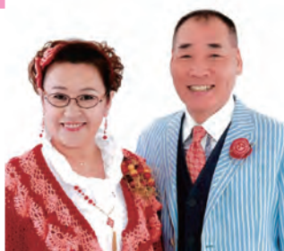
宮川 大助・花子さん 漫才師