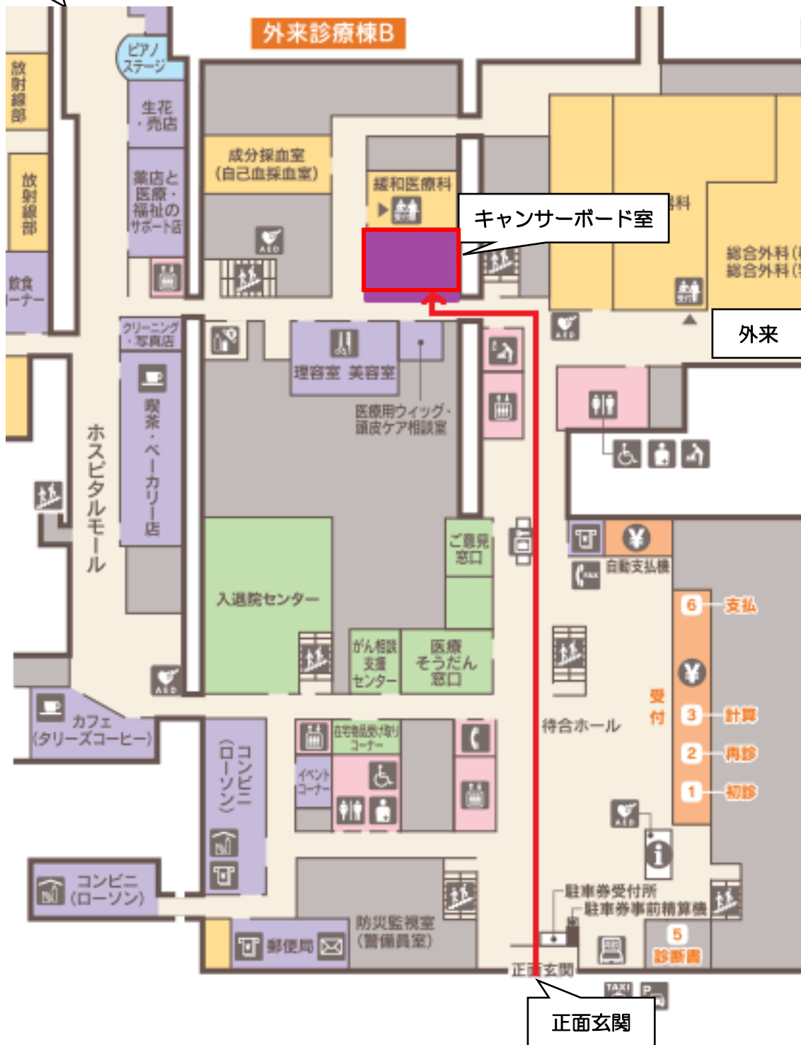
東北大学病院 1階 院内MAP