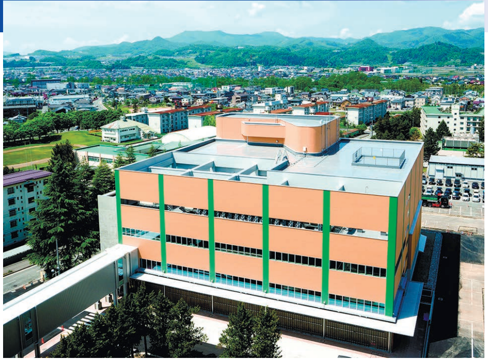
山形大学医学部東日本重粒子センター